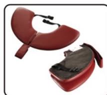
Podpera na ruky