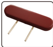
Podpera na ruky