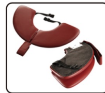
Podpera na ruky